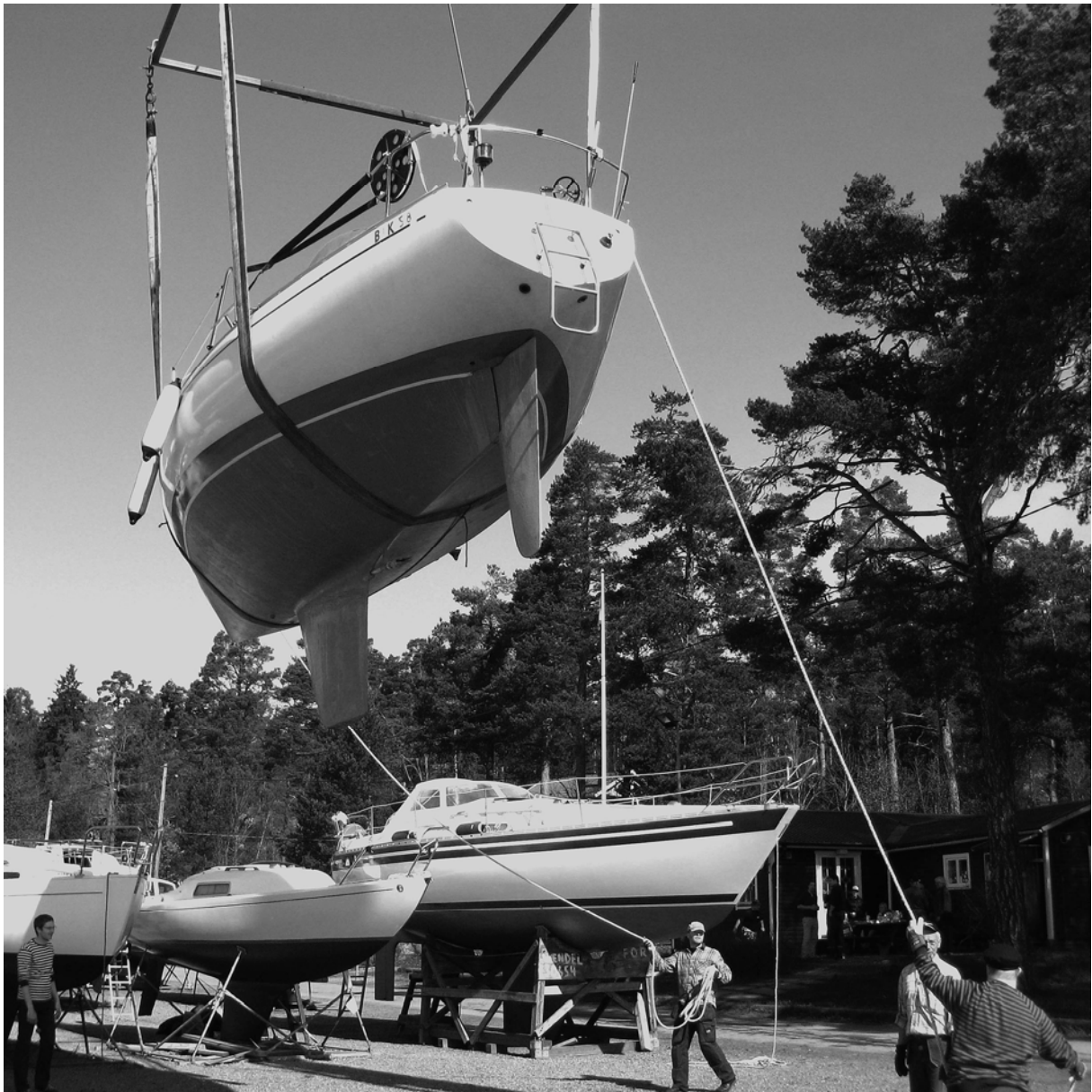
Stilstudie från sjösättningen 2007. Soligt, varmt och vindstill. Perfekt.