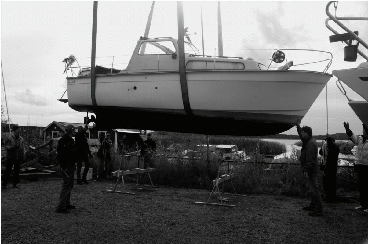
Stilstudie från torrsättningen 2009.