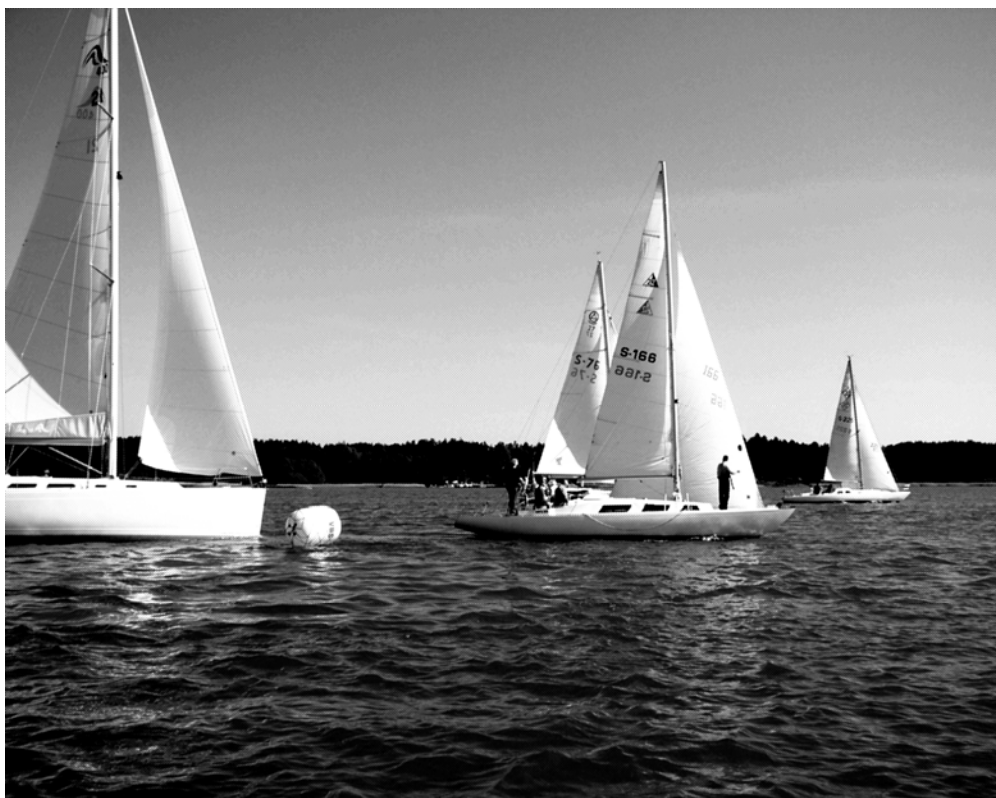
Bilder från den spännande starten.