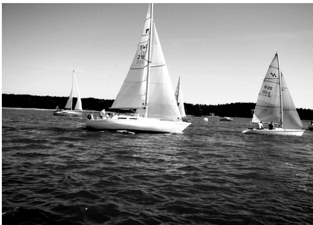
På VBS hemsida finns fler bilder och hela resultatlistan.